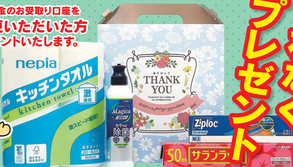
※写真はイメージです。実際の商品と異なる場合がございます。