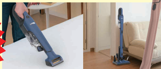
Shark 充電式サイクロンスティッククリーナー ※商品はイメージです。カラーは選べません。