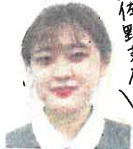
下條 / 向佐野支店へ