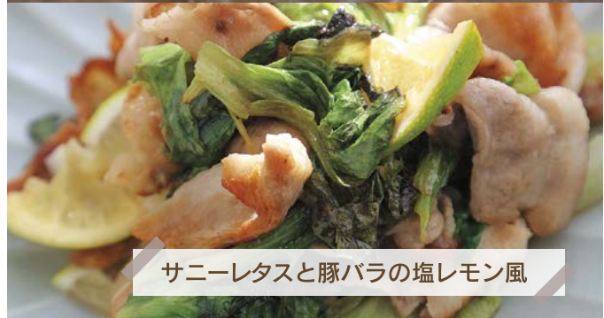
サニーレタスと豚バラの塩レモン風