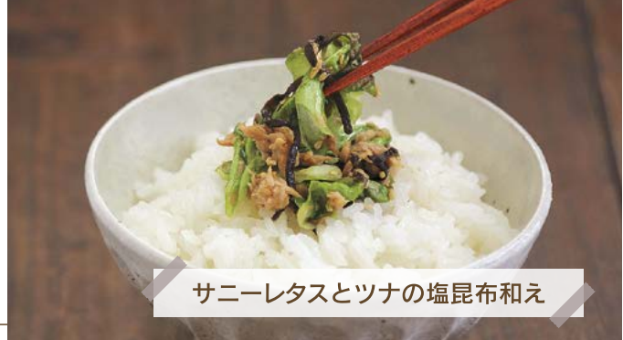
サニーレタスとツナの塩昆布和え